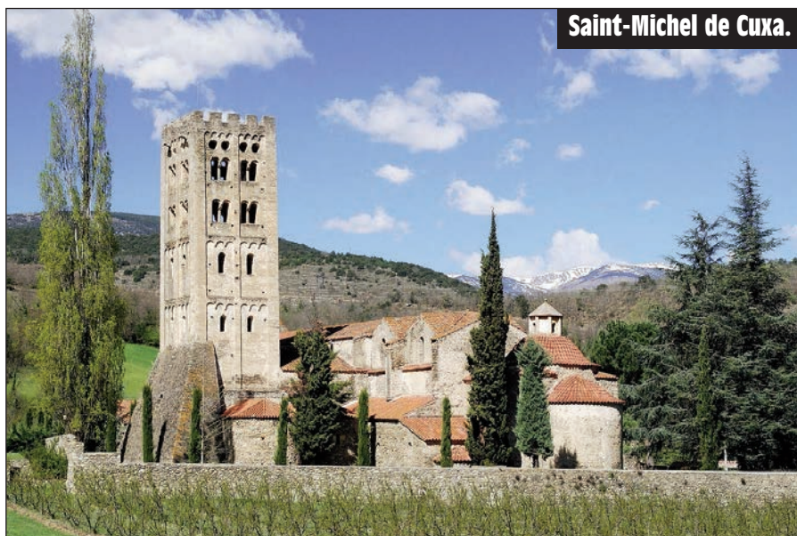
Saint-Michel de Cuxa.